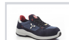
S0300 TENGERÉSZKÉK/S EAPORT