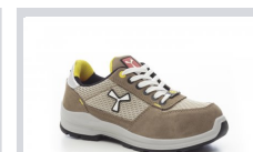
S0201 KHAKI/HOMOKSZÍ NŐ