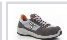
S1003 ACÉLSZÜRKE/VILÁGOS SZÜRKE